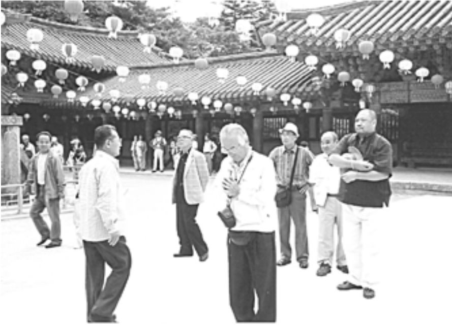
ナムアマダブツ? カムサハムニダ? (仏国寺境内)

仏様・山門・双塔が数多くあり、世界遺産でもある 仏国寺 (ぶつこくじ)。熱心にお参りされている方の多さに、感心させられました。我寺にもお参りに！次に青磁の窯元見学。名だたる先生の仕事ぶりを拝見させて戴き説明を聞き、買い求める際にも直接アドバイスしてくれた。その後昼食で本場石焼きビビンバを食べて、皆さんお昼寝タイム。目が覚めたら窓の外は再び釜山の賑やかな街並みで、国際市場に降りた。色々なお店を見てはあれこれと買い物も楽しみ、ホテルへ早めに入り各自夕食まで個人行動。中には本物のピストルを打ちに行かれた方々もあり、興奮したまま帰ってきて要注意人物と化していました。韓国最後の晚餐は、上流階級の人達が行くお店で、なぜだか海鮮鍋・イイダコの生きたお刺身等を戴きました。その夜は、アカスリエステに行く人、バーでゆっくり生歌を聴きながらくつろがれた人、やっぱりどこかの部屋で酒飲んで騒いだ人、それぞれ楽しまれ最終日、土産をどっさり買って釜山空港より帰路へ着きました。