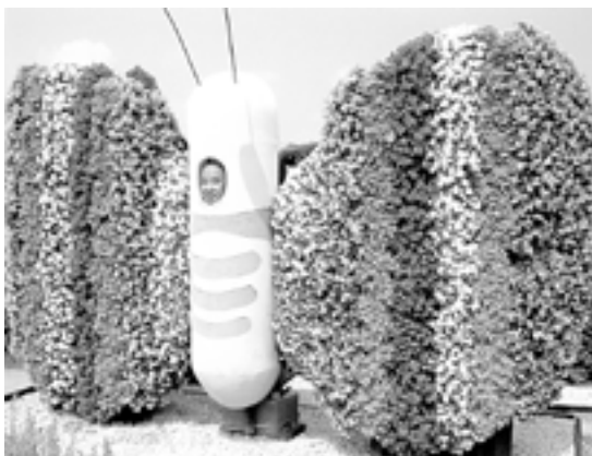
住職チョウチョだ～