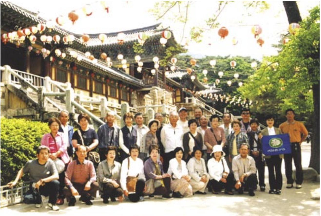
韓国・慶州 仏国寺

浄土真宗本願寺派(西本願寺) 撰取山 長照寺 静岡県三島市徳倉1195-817 電話 055-988-4242 URL http://homepage3.nifty.com/tyo-syo-ji/ E-mail: tyo-syo-ji@nifty.com