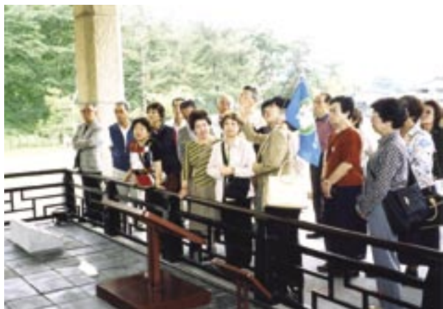
慶州国立博物館にて