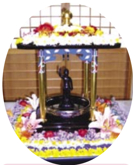
釈尊降誕会「花まつり」